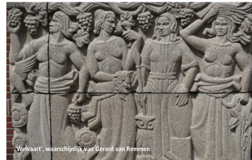
'Welvaart', waarschijnlijk van Gerard van Remmen

Graag leid ik u rond langs de in deze serie artikelen beschreven gebouwen in de Archipel&Willemspark. bartelbrouwer@gmail.com