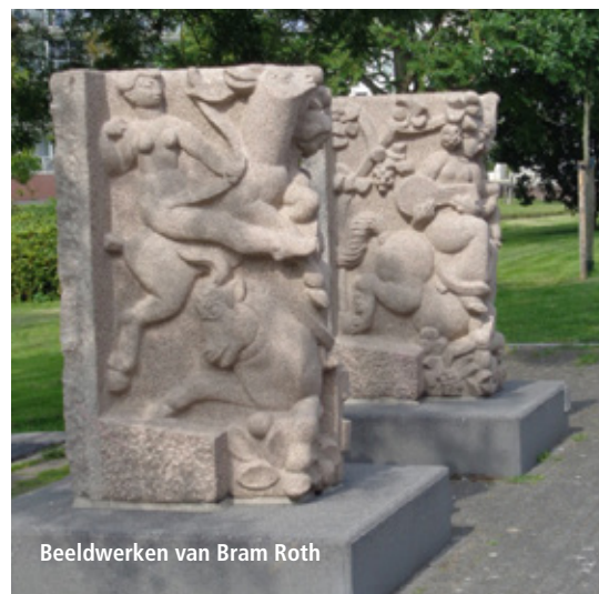
Beeldwerken van Bram Roth