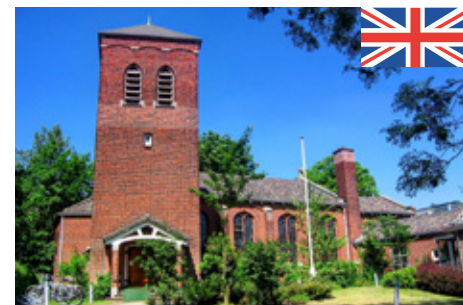
P11 Anglican Church The Hague