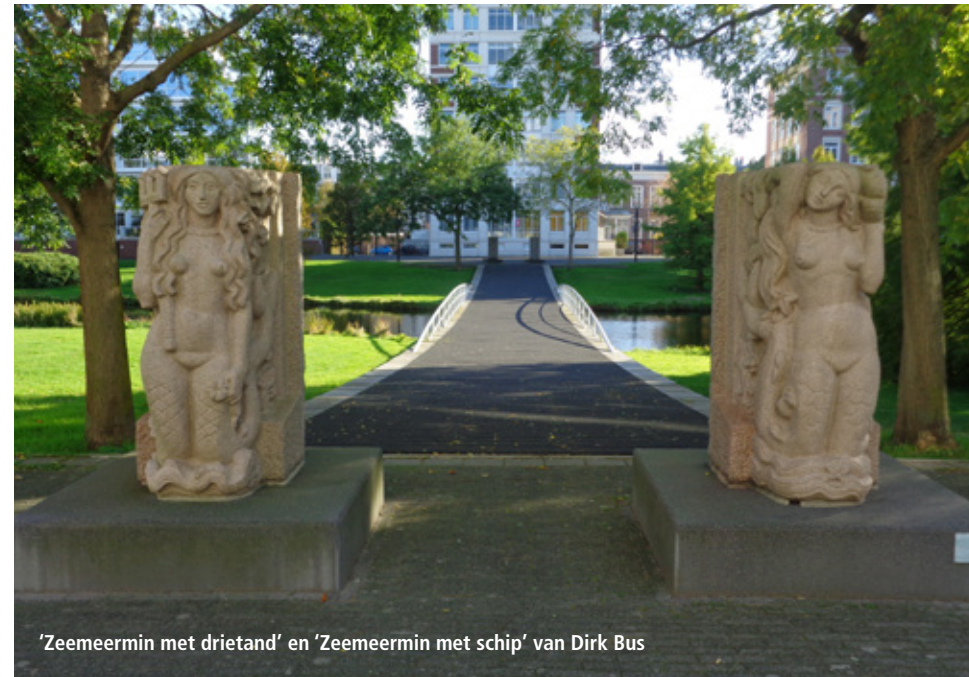
'Zeemeermin met drietand' en 'Zeemeermin met schip' van Dirk Bus

Aan de kant van het Nassaplein zijn twee reliëfs 'Neptunus' en 'Figuur op dolfin' te vinden. Deze zijn vervaardigd door Gerard van Remmen. De koppeling met het gebouw waarvan ze onderdeel uitmaakten is