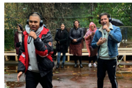
P9 Audiotour 'Oxigen'