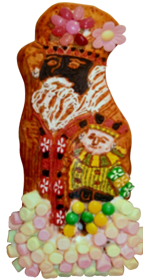
Taai-taai pop. Zwarte Sint zweeft op een wolk van mini-marshmallows, met een witte Piet in ADO-shirt aan zijn zijde.

Te druk voor gedichten en surprises en op zoek naar een alternatief voor jong en oud om de verjaardag van de goede Sint toch nog te vieren? Waarom niet een avondje ouderwets koek vergulden? Via het internet zijn taaitaai poppen van Van Delft te bestellen. Van Delft is de enige producent die ze tegen sinterklaastijd nog op de markt brengt.